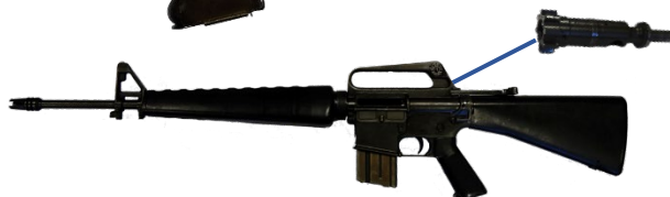
图 5：拟宣布为枪械的火器元件