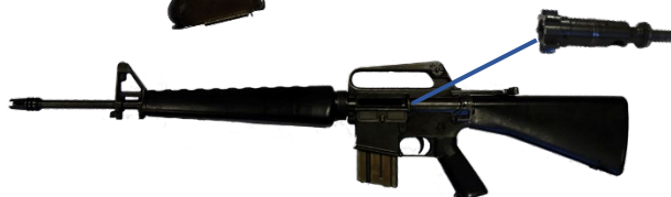
圖 5：擬宣布為槍械的火器元件